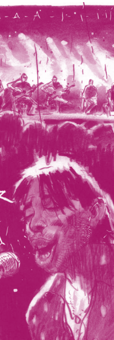
Illustration de Benjamin Flao Soléa

qui offre un parcours à travers Buenos Aires et son histoire ; un voyage dans l'espace et dans le temps qui plonge le lecteur dans l'univers mythique de la ville, de la littérature de Borgès et du monde du tango.