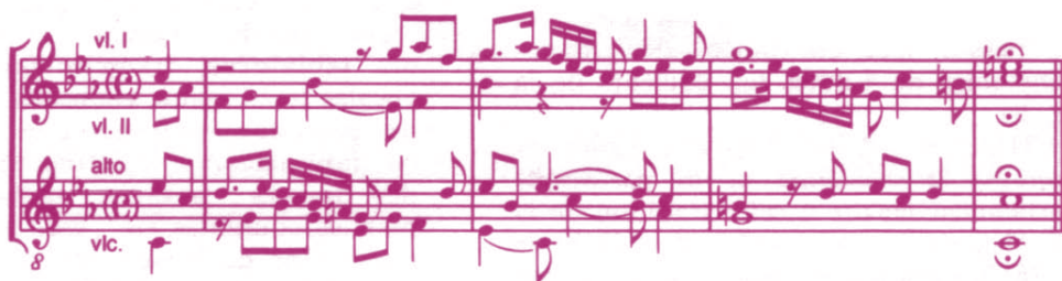
W. Byrd, Fantaisie pour quatuor de violes, fin

Le célèbre violiste Marin Marais se souvient de son maître, un musicien solitaire et intransigeant, Monsieur de Sainte-Colombe. Il raconte la vie austère de cet homme, l'éducation sévère qu'il infligea à ses deux filles après la mort de sa femme, ainsi que la recherche d'une perfection absolue dans son art. Il raconte l'initiation qu'il a reçue de lui et surtout l'antagonisme qui l'opposa