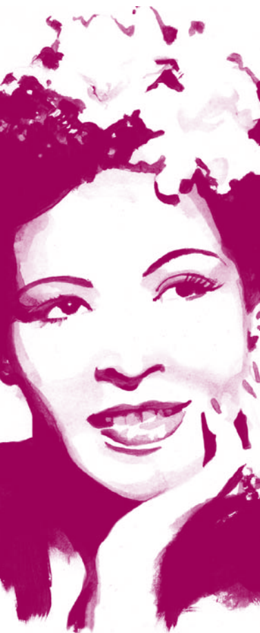
Black Billie de Claude Beausoleil Illustration de Marc Taraskoff

« Je veux être considéré comme un poète de jazz soufflant un long blues au cours d'une jam session un dimanche après-midi. » Jack Kerouac