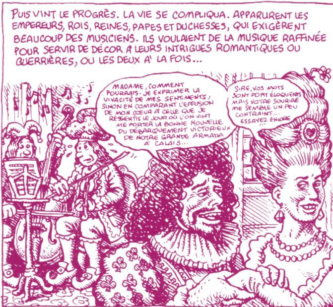
Illustration de Robert Crumb, Mister Nostalgia.

éd. Stock, 2005 Six personnages dressent tour à tour, devant un interlocuteur silencieux surnommé Votre Hauteur , le portrait d'un musicien retiré du monde. Petit à petit, la personnalité de l'absent se dessine.