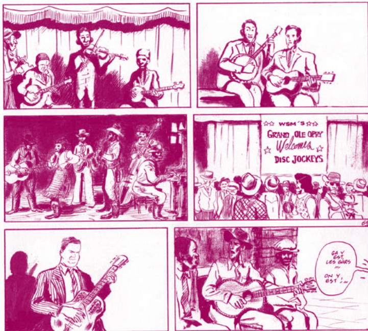
Illustration de Franz Duchazeau

Il rencontre la légende du blues, Robert Johnson, qui va l'aider à devenir Meteor Slim, un grand musicien. C'est la vraie fausse histoire d'un bluesman ou la quête tragi-comique d'un homme cherchant à échapper à sa condition par la musique, servie par un dessin magnifique jouant du noir et du blanc.