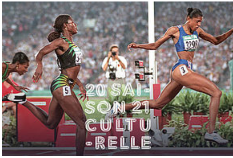
Marie-José Pérec